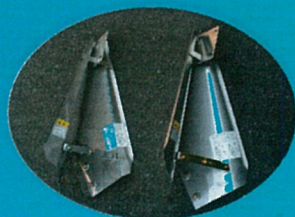
角プラウ (特注仕様)