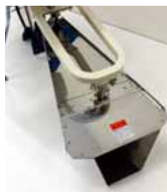
フタプラウを標準装備!