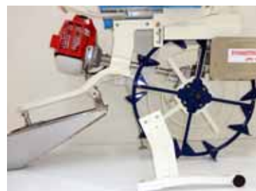
優れたメンテナンス性 (フレームの分割化)