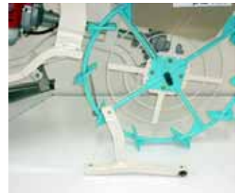
オプションで湿田用プラウもご用意できます！ 優れたメンテナンス性