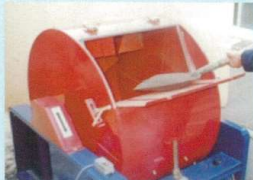
①土入れ（投入口の高さ調節可！）