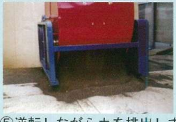
⑤逆転しながら土を排出します。 （約4～5回転）