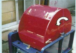
④一端停止後、逆転を始めます。