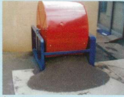
⑥自動的に停止します。