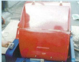
②フタを閉めスイッチON